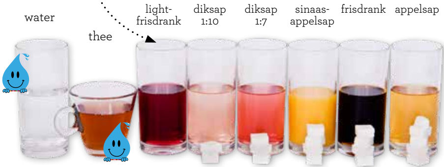
Hoeveelheid suiker in een glas van 150 ml

In light-frisdrank zit geen suiker, maar het zorgt er wel voor dat je kind went aan een zoete smaak. En het is slecht voor het tandglazuur.