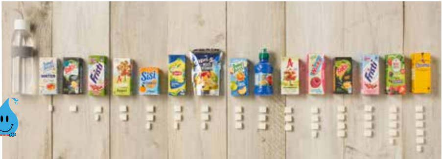
Op basis van etiketinformatie juli 2019

Thom, tandarts en vader: 'Als tandarts zie ik veel kinderen met gaatjes. Te veel zoete drankjes zoals sap en frisdrank, maken je tanden kapot. Mijn advies: geef je kinderen vaker water. Zo blijven hun tanden mooi.'